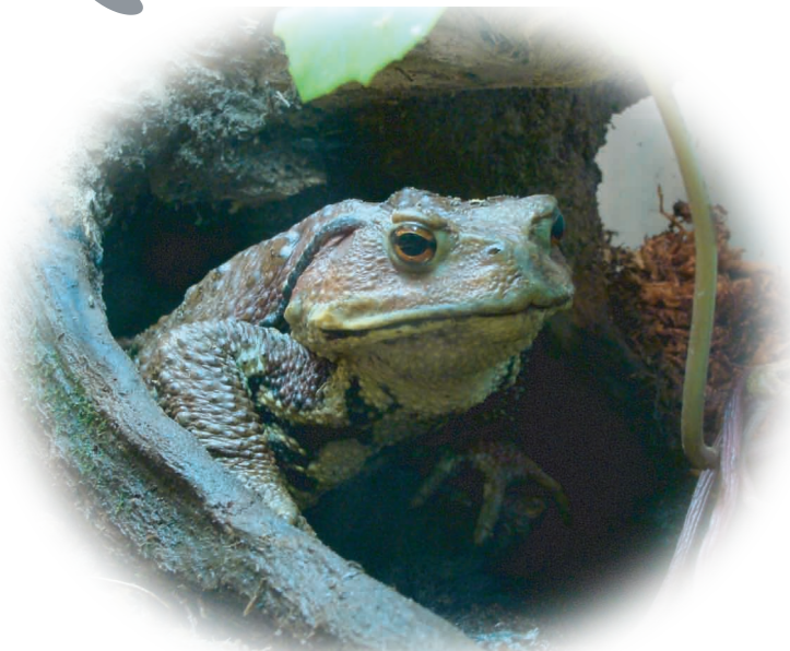
にほんひきがえる

かえるのうたが きこえてくるよ けろけろけろけろ けろけろけろけろ くわくわくわ