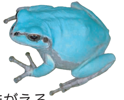
あまがえる (きいろをもっていない)

かえるをまもろうよ みんなでももろうよ けろけろけろけろ けろけろけろけろ くわくわくわ