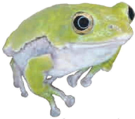
しゅれーげるあおがえる